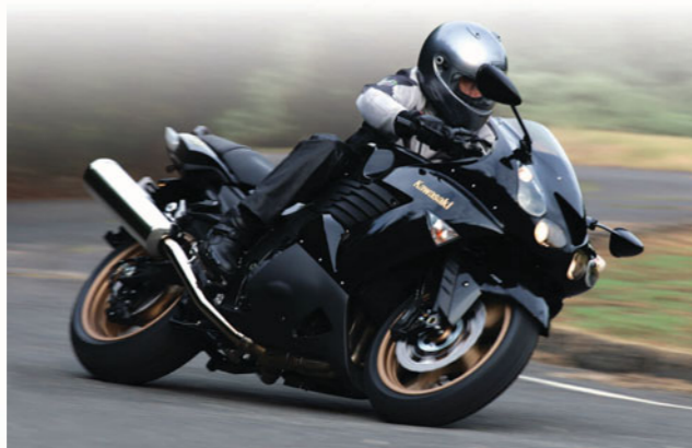
メタリックムーンダストグレー×メタリックスパークブラック