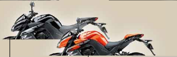
メタリックスパークブラック