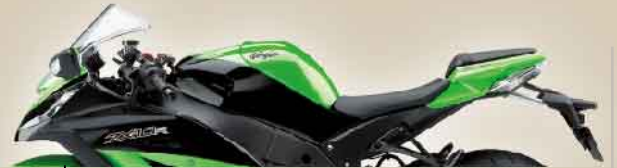
ライムグリーン×メタリックスパークブラック