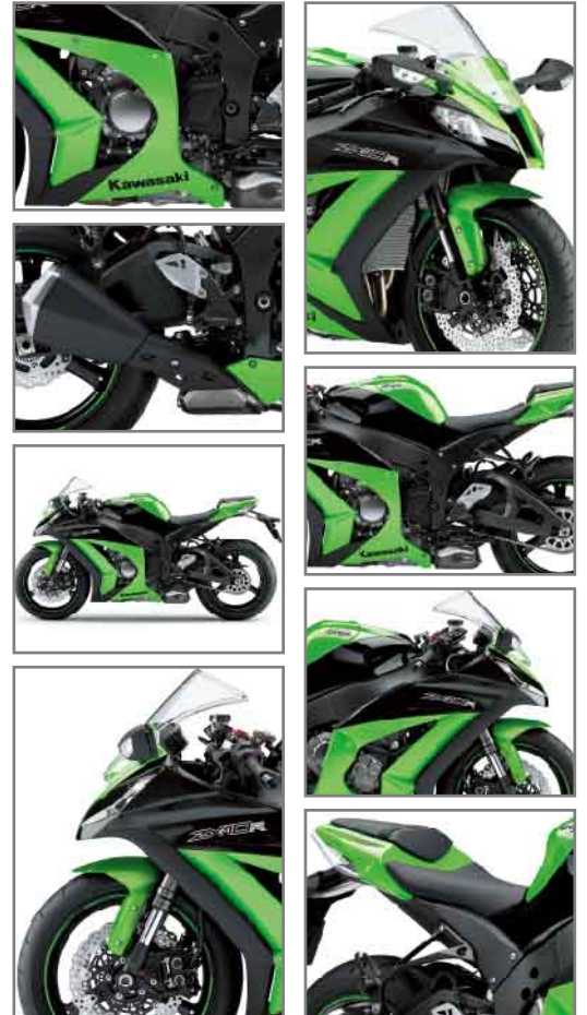
Copyright (c) BRIGHT CORPORATION All Rights Reserved.

リサイクル促進センター http://www.jarc.or.jp/motorcycle/